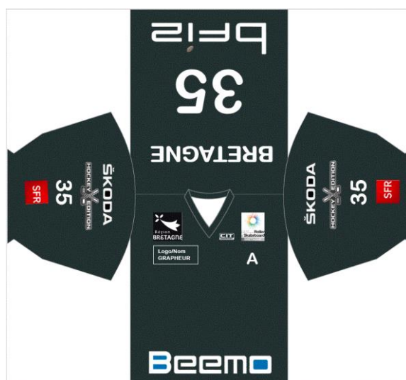
Matrice avec sponsors